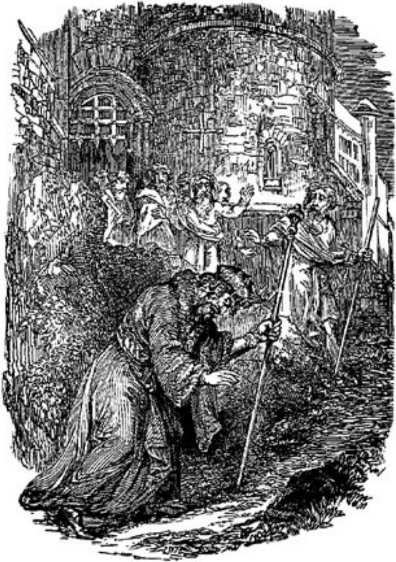
Bei seiner Rückkehr vom Hof Schaddais beklagt der Oberbürgermeister das Schicksal von Menschen-Seele