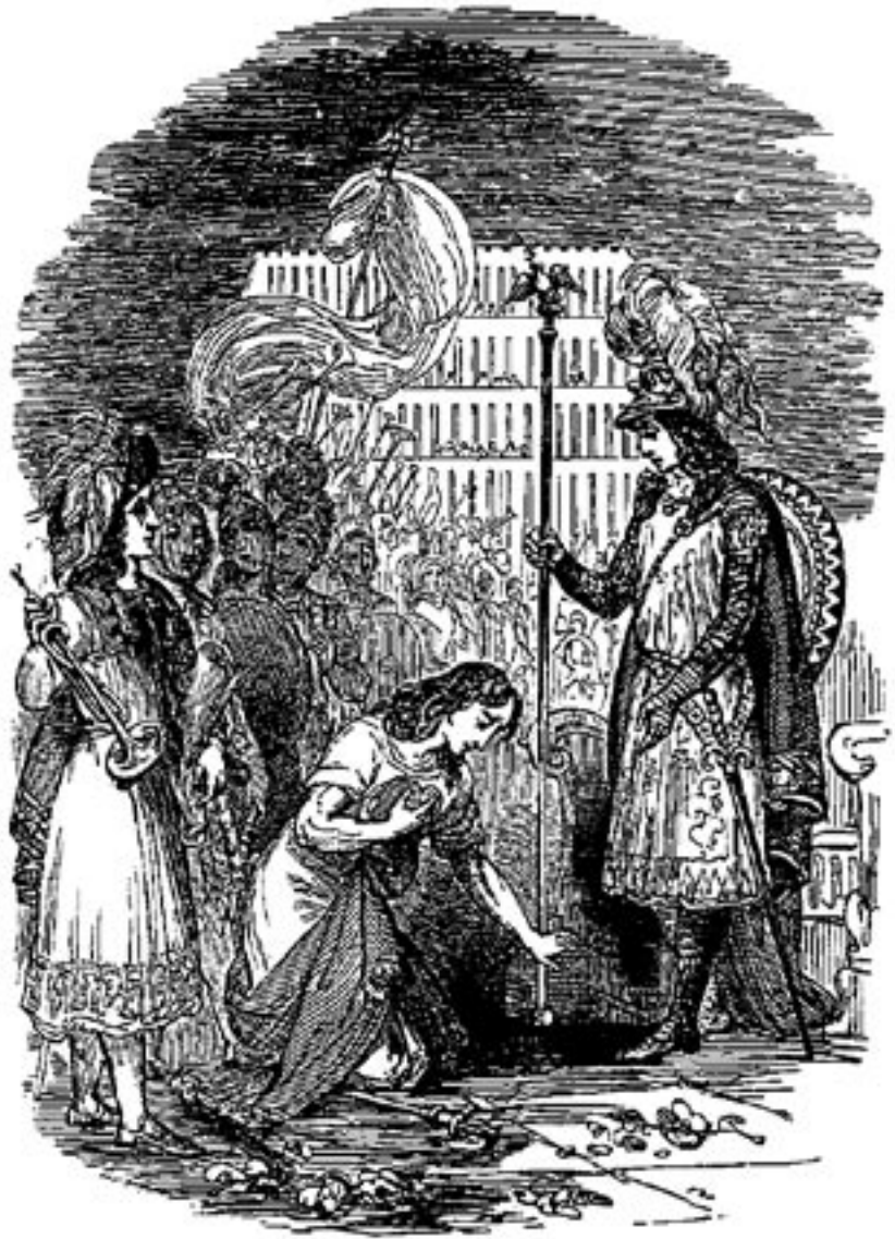
Fürst Immanuel ernennt Erfahrung zum Hauptmann