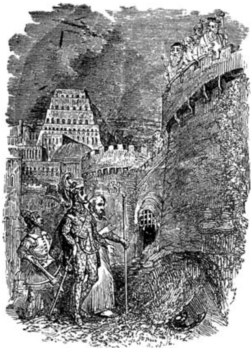
Diabolus vor Menschen-Seele