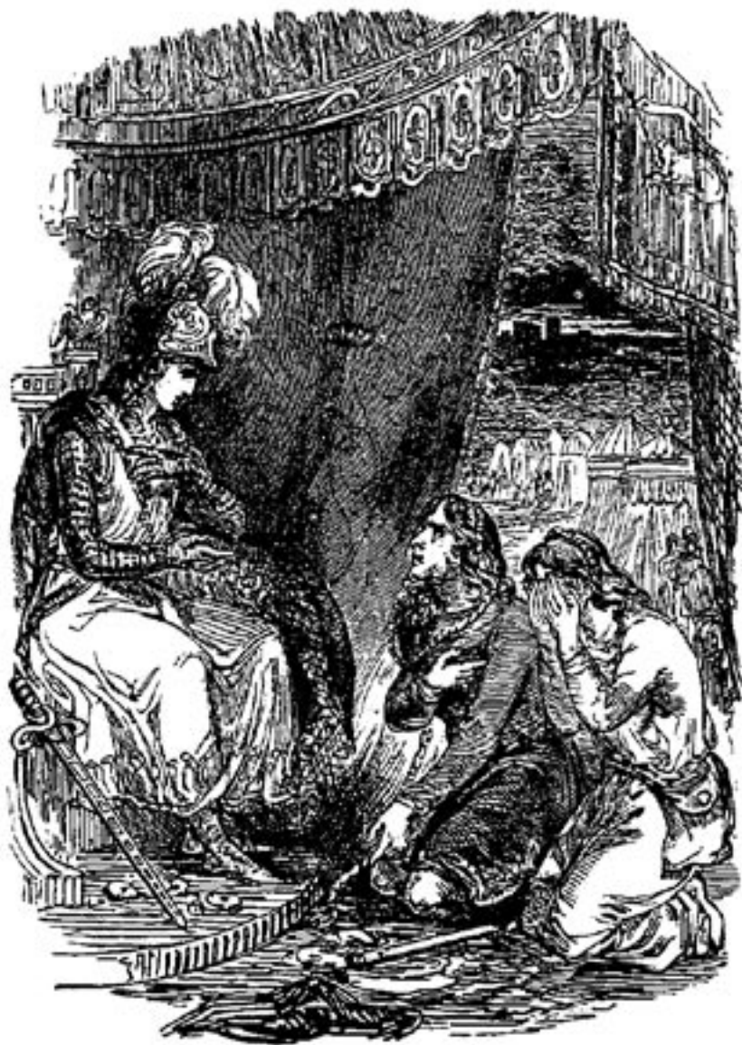
Erwachte-Sehnsucht und Nassage vor Fürst Immanuel