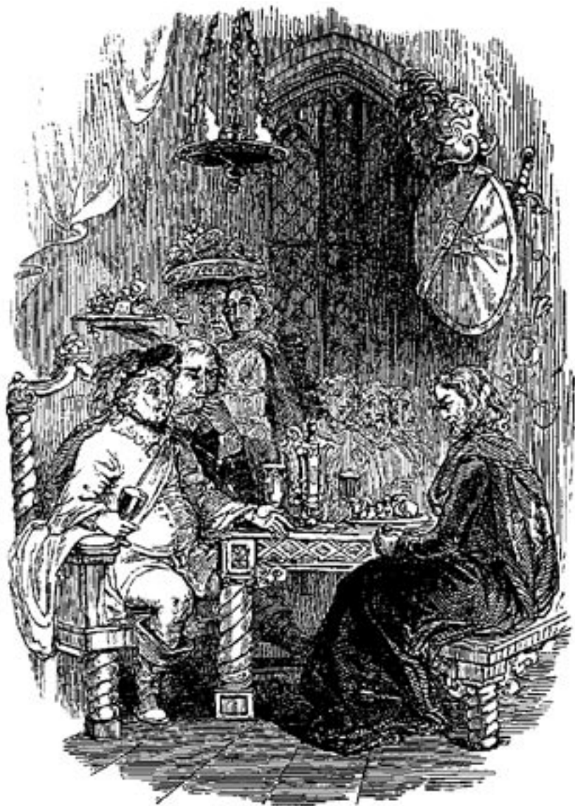
Fleischliche-Sicherheit spricht bei seinem Gastmahl mit Gottesfurcht