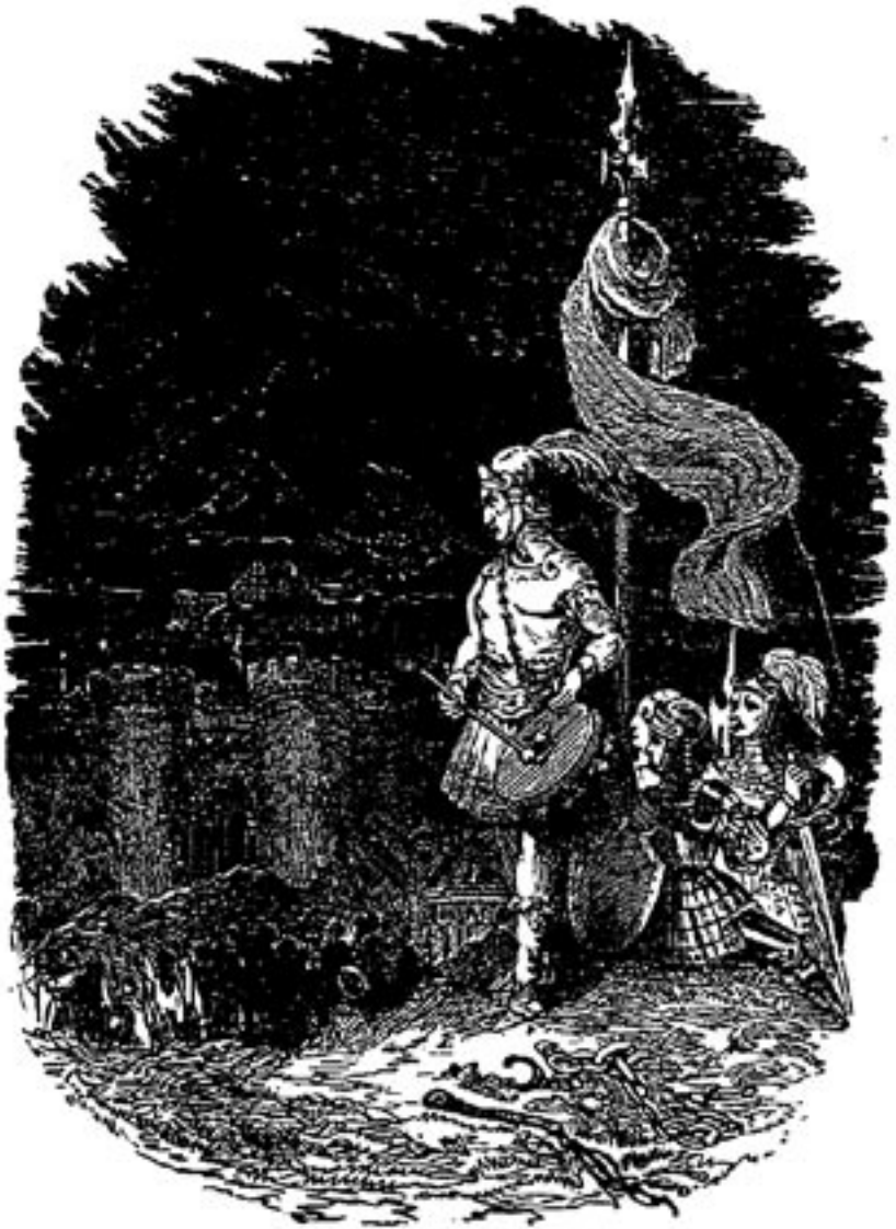
Der Trommler des Diabolus vor Menschen-Seele