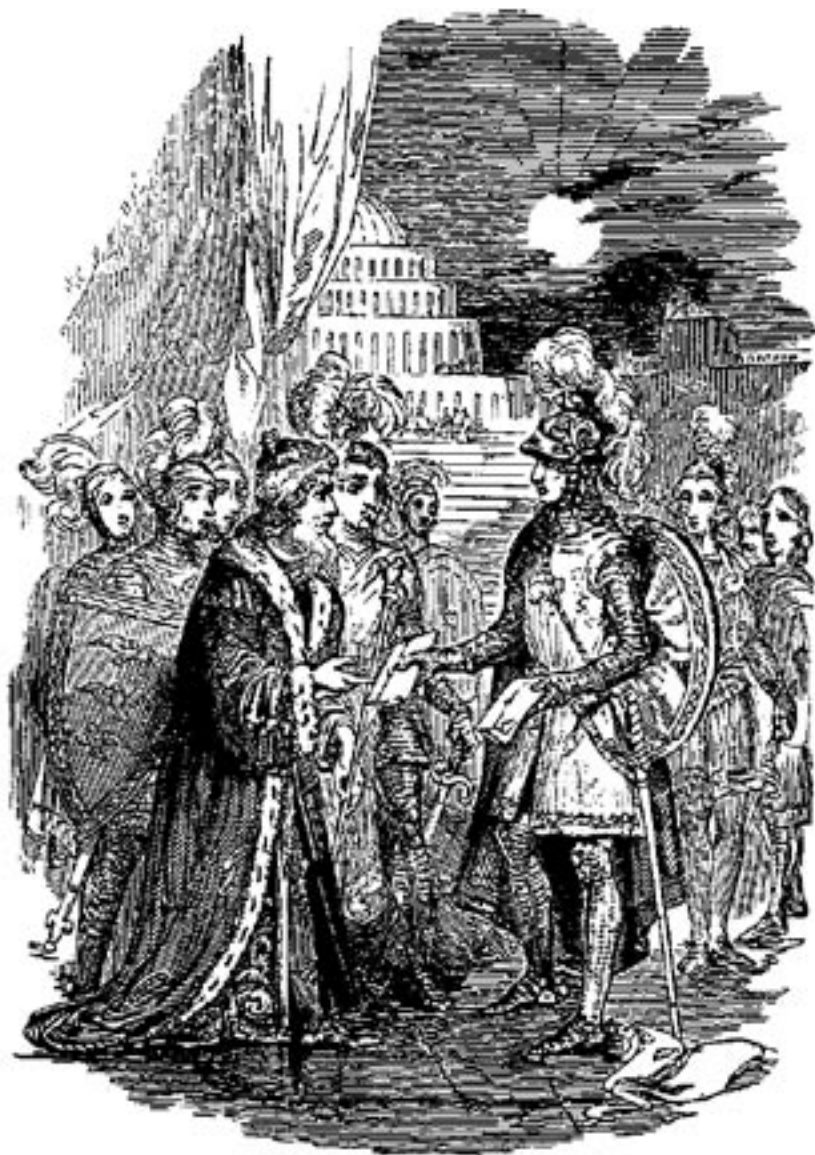
Hauptmann Glaube überreicht dem Fürsten Immanuel die Bittschrift