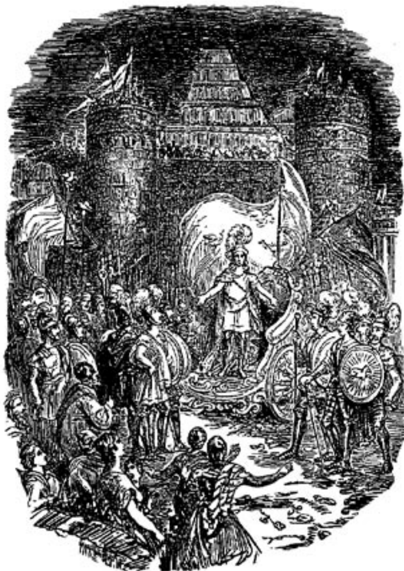
Fürst Immanuel's Rede an Menschen-Seele