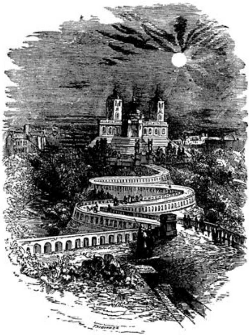
Die Stadt Menschen-Seele