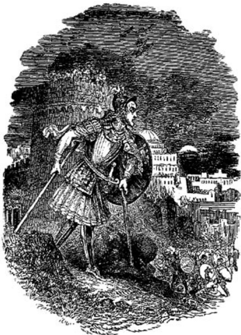
Hauptmann Erfahrung eilt auf das Schlachtfeld