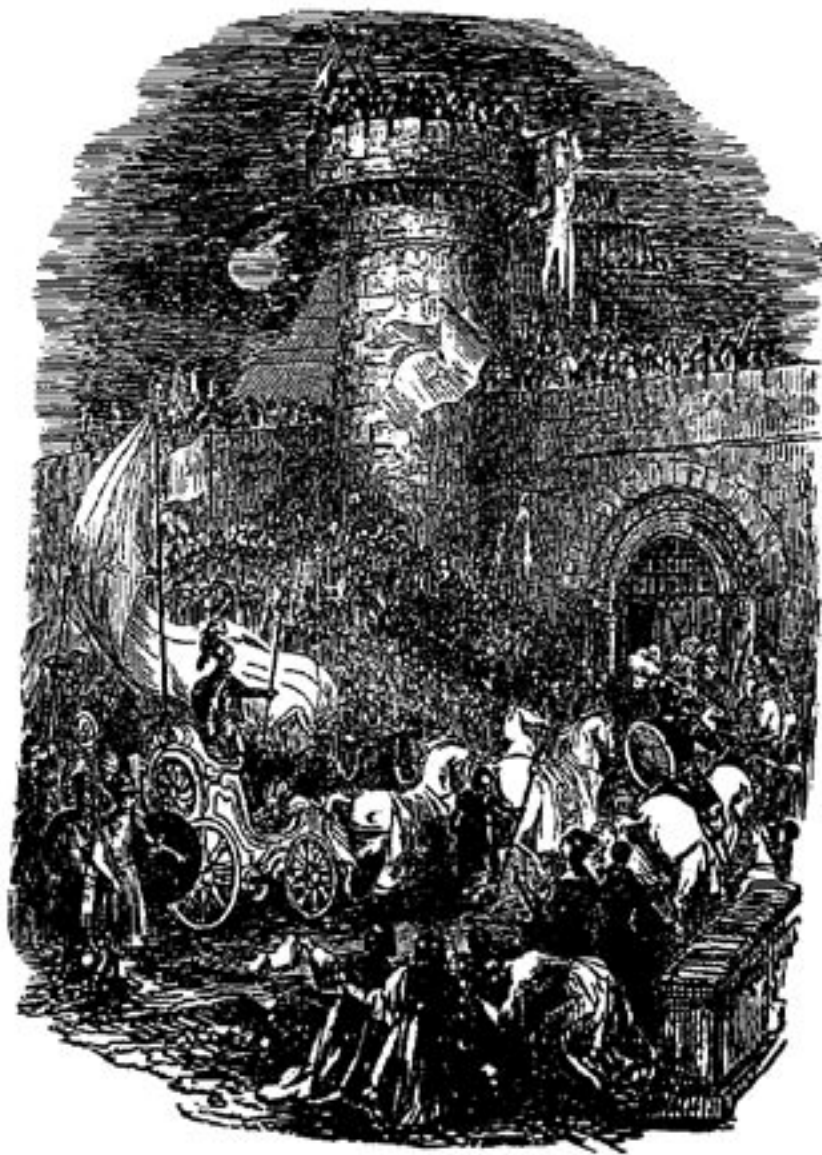
Fürst Immanuel zieht in Menschen-Seele ein