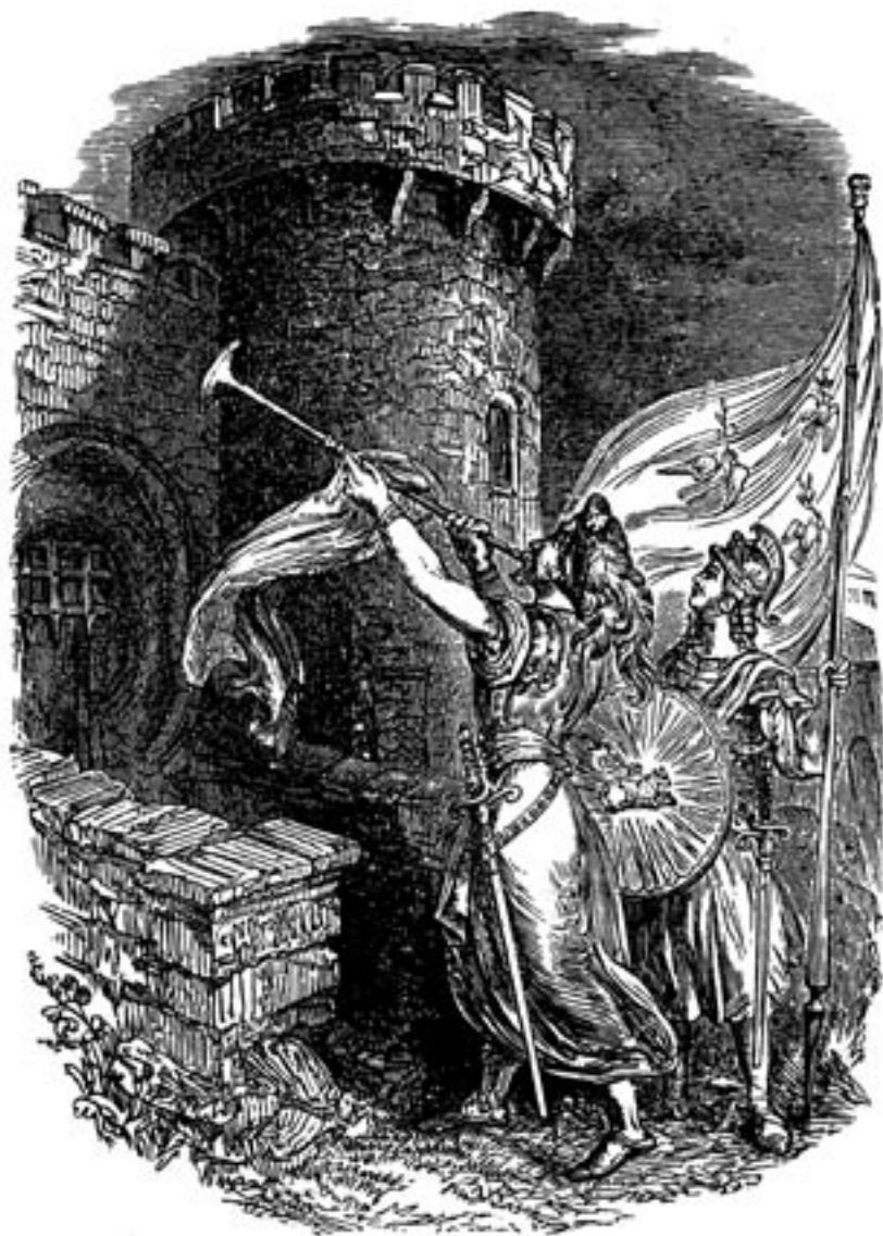
Der Trompeter des Feldherrn fordert die Stadt auf, die Botschaft zu hören.