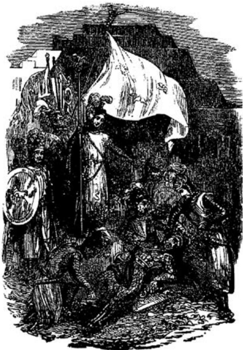
Diabolus wird mit Ketten gebunden