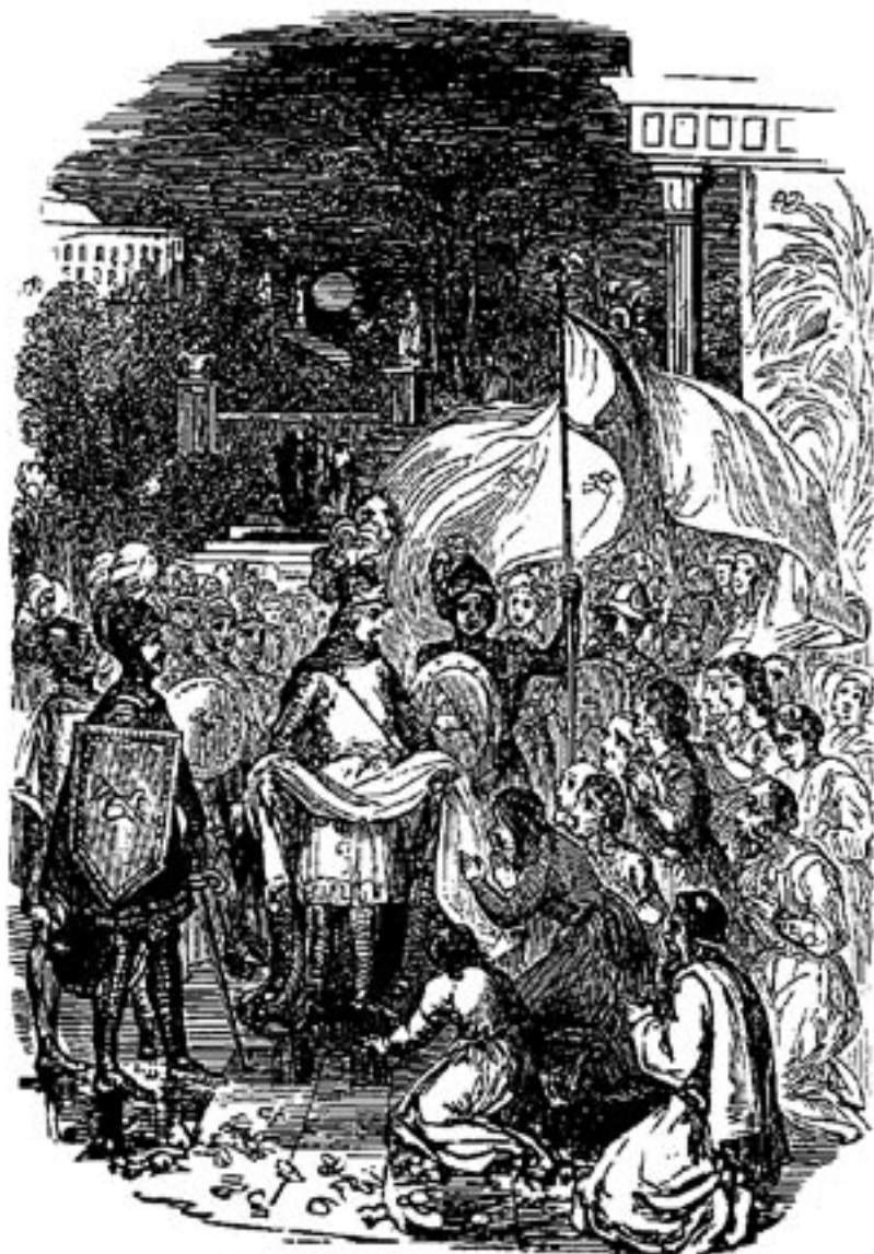
Fürst Immanuel teilt weiße Kleider aus