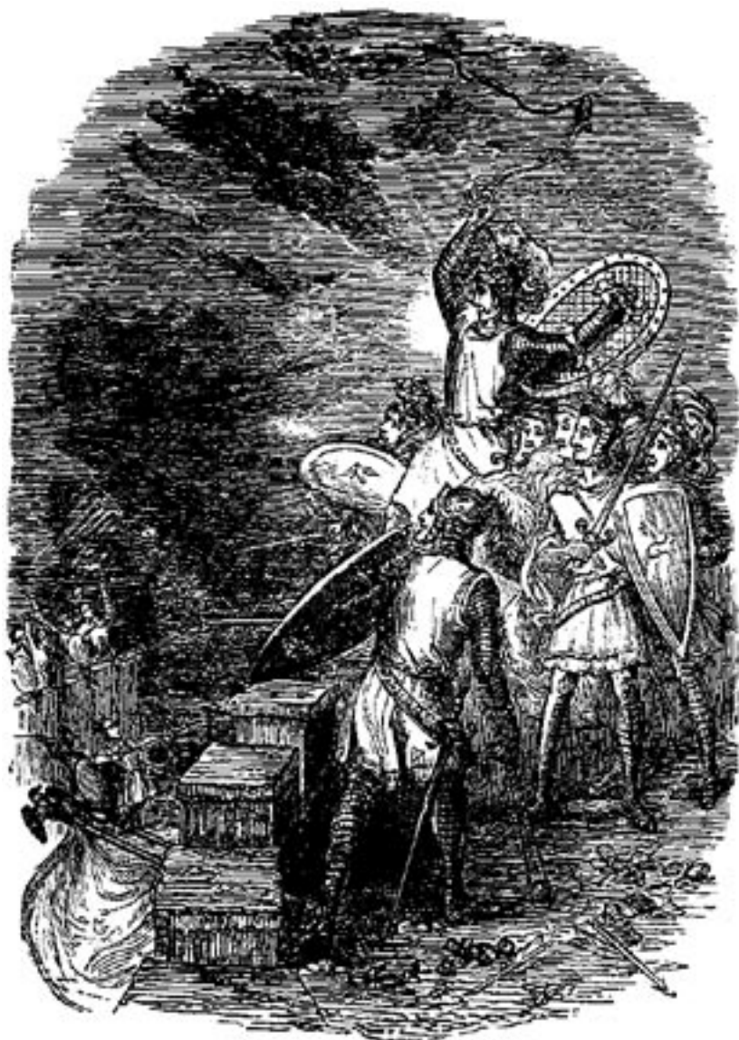
Die Hauptleute verteidigen die Burg gegen die Diabolianer