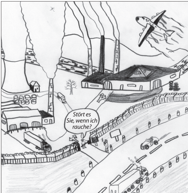
Abbildung 1. Urheber: Marius Pitzer, Marburg.

Drittens: Warum gibt es in unserem Leben, in unserer Welt solche krassen Widersprüche, wie sie die Karikatur (Abbildung 1) in zugespitzter Weise zeigt?