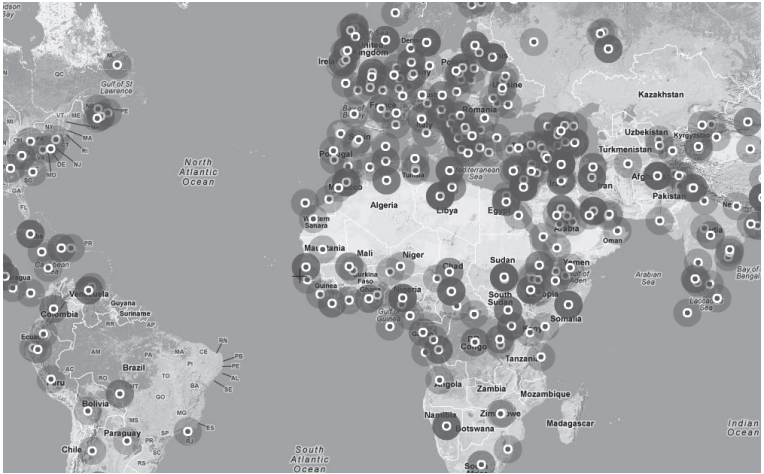
Abbildung 2: Kriege und bewaffnete Konflikte 1900–2000.