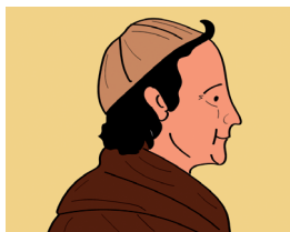
Philipp Matthäus Hahn 1739–1790

Sie übernahmen engagiert Verantwortung und suchten den Kontakt zu anderen Verantwortungsträgern aus Wissenschaft, Wirtschaft und Politik – nicht selten im konstruktiven Widerspruch. Sie erforschten die Texte der Bibel von Grund auf und gründeten Bibelanstalten, um das Wort GOTTES zu verbreiten.