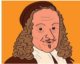
Philipp Jacob Spener 1635–1705

Am Anfang waren es nur fromme Wünsche. Dass Christen wieder mehr gemeinsam in der Bibel lesen. Dass Glaube wieder mehr im Alltag praktisch wird. Dass Christen aufhören, sich im theologischen Streit zu verlieren – und anfangen, sich auf den Weg zum Nächsten zu machen.