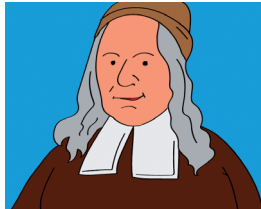
August Hermann Francke 1663–1727

Am Anfang waren es nur fromme Wünsche. Dass Christen wieder mehr gemeinsam in der Bibel lesen. Dass Glaube wieder mehr im Alltag praktisch wird. Dass Christen aufhören, sich im theologischen Streit zu verlieren – und anfangen, sich auf den Weg zum Nächsten zu machen.