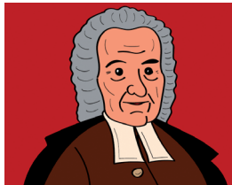
Johann Albrecht Bengel 1687–1752

Aus den frommen Wünschen wurde bald eine Bewegung. Christen formten sich zu Gemeinschaften innerhalb ihrer Kirchen. Sie gründeten Waisenhäuser, Krankenhäuser, Schulen und Hilfswerke. Sie wurden Hoffnungsträger, Wegbereiter und Wegbegleiter. Sie wollten, dass die ganze Welt von GOTTES Liebe erfährt.