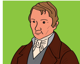
Johannes Rebmann 1820–1876

Sie machten Fehler – und lernten daraus. Und zu jeder Zeit verbanden sie ihre Leidenschaft für Kirche mit der Suche nach tiefgehenden, tragenden Inhalten und frischen Formen für die beste Botschaft der Welt.