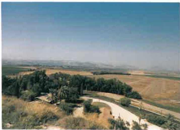
メギドの平野から見たハルマゲドンの谷