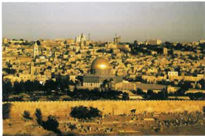
オリーブ山から見たエルサレム

異邦人国家は礼拝のためにエルサレムにのぼってきます。それを拒む国は災害や干ばつに見舞われるでしょう。この時代に生まれる子どもたちも罪の性質を持っているので「新しく生まれること」が必要です。救いはいつの時代でも、キリストに対する信仰によるのです。す