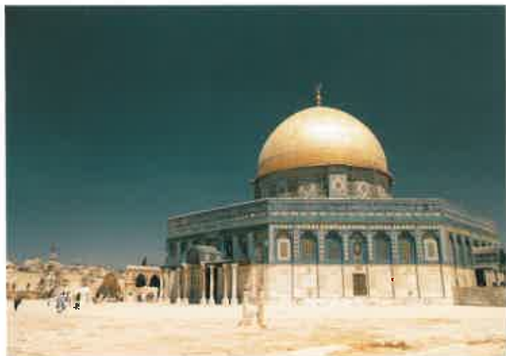
エルサレムにある神殿の丘 岩のドーム

エルサレムは、これまで以上に紛争の絶えない場所となるでしょう。預言者ゼカリヤは預言してこう言いました。「見よ。わたしはエルサレムを、その回りのすべての国々の民をよろめかす杯とする。ユダについてもそうなる。エルサレムの包囲されるときに。その日、わたしはエルサレムを、すべての国々の民にとって重い石とする。すべてそれがかつぐ者は、ひどい傷を受ける。地のすべての国々は、それに向かって集まって来よう」(ゼカリヤ12:2-3)。エルサレムはまだ、国際的には正式に承認されてはいませんが、一般にはイスラエルの首都と