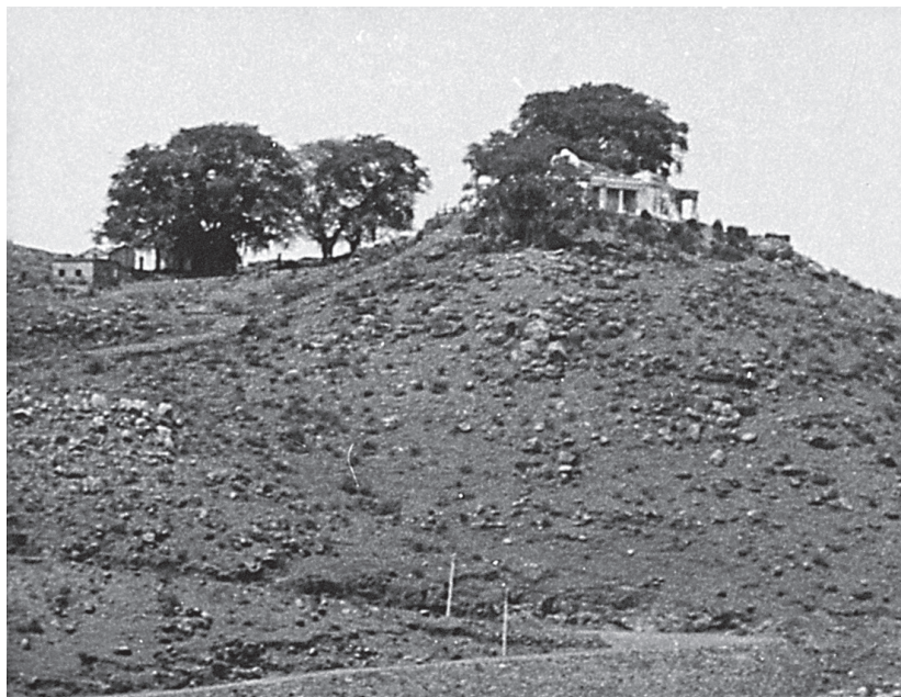
Холм Паллаварам вблизи Мадраса, где в 1941 году проходила ночь бдения.

просили о водительстве и руководстве. Молитва за молитвой возносились к престолу Божьему. Опираясь на библейские обетования, мы спрашивали, какой должен быть для нас следующий шаг в плане Божьем. Я вспоминаю, как огни в Мадрасе потухали один за другим (должен признаться, что мне трудно было закрыть глаза). Затем потухли последние огни, и удивительная, почти устрашающая темнота объяла нас.