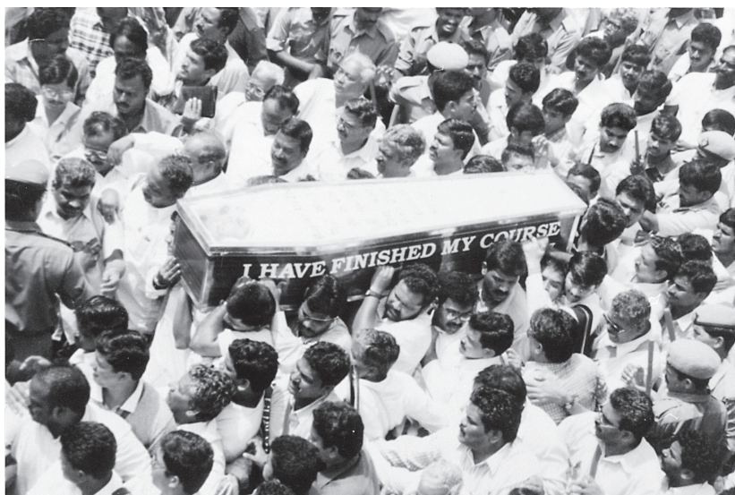
Друзья несут гроб с останками Бахта Синга

В пятницу, 22 сентября 2000 года, в большей части индийского города Хайдарабада остановилось движение транспорта. Площадь от здания «Хеврона», которое с 1950 года было центром национального и интернационального служения Бахта Синга, и до здания «Ермона», а также все главные и прилегающие к ним улицы между большой дорогой Голконда Кросс Роудс и кладбищем Нараджнагуда заполнили примерно четверть миллиона человек. Предприятия и учреждения были закрыты, движение в этом районе остановлено, и полиция старалась упорядочить массы людей вокруг гроба. От «Хеврона» до расположенного в трех километрах от него кладбища гроб несли три часа. Эти похороны были самой большой демонстрацией Евангелия, которая когда-либо была в городе. Верующие продвигались очень