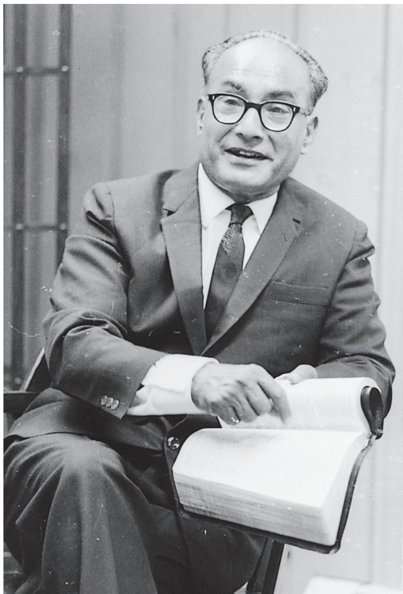
Бахт Синг во время лекции, организованной «Интернациональным студенческим институтом» в Вашингтоне, 1969 г.